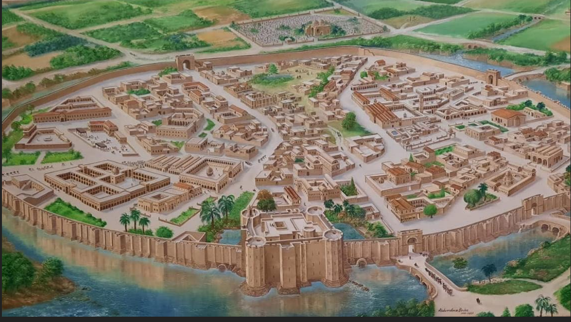
1000Yıl Önce ve 1000 Yıl Sonra Harran Üniversitesi